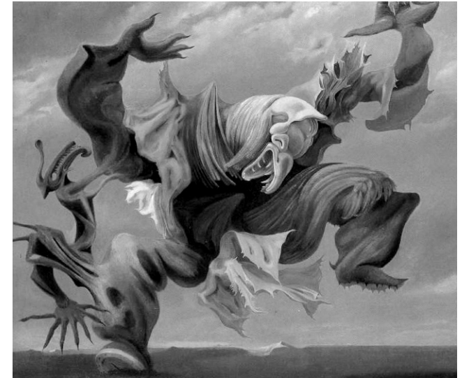
Max Ernst, Der ‚Hausengel‘ 1936